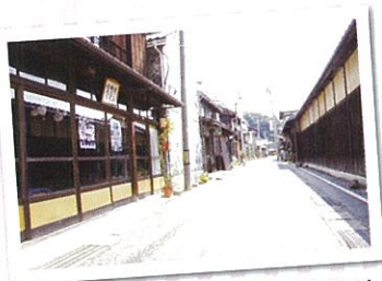
▲しおまち唐琴通り