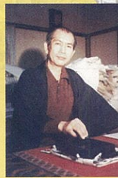
書家・詩人 相田みつを 1924年 ~ 1991年